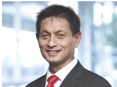
Arie Prabowo Ariotedjo

rakan bakal memiliki saham mayoritas minimal 51%, dan sisanya Huayou dalam pembentukan JV. Para pihak yang terlibat terlebih dahulu akan melakukan HoA sebelum JV dibentuk. Setelah itu prosesnya akan dilanjutkan ke studi kelayakan (feasibility study).